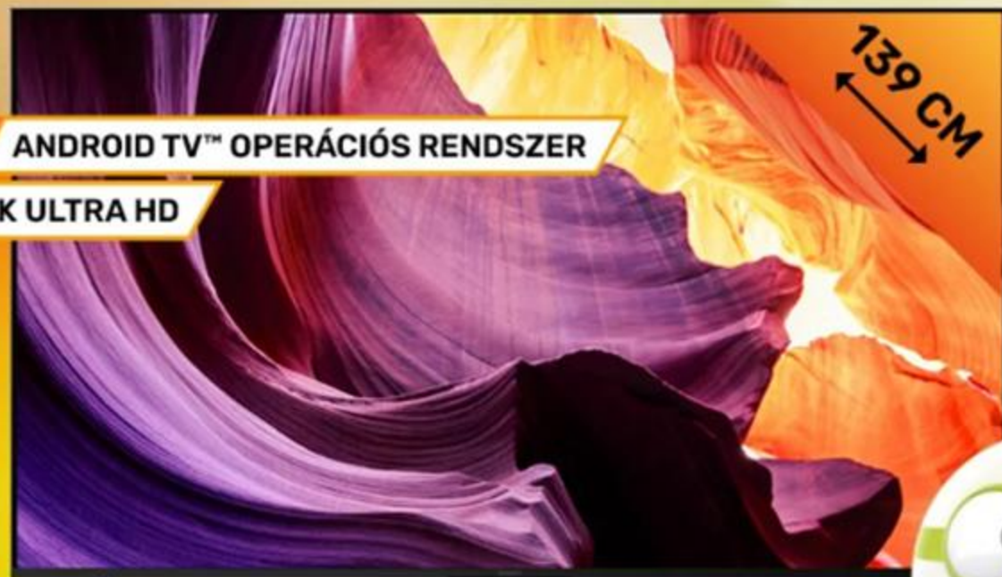
371712 SONY 55" SMART LED TV KD55X80KAEP, 4K HDR PROCESSZOR X1™, TRILUMINOS PRO™, DOLBY ATMOS™