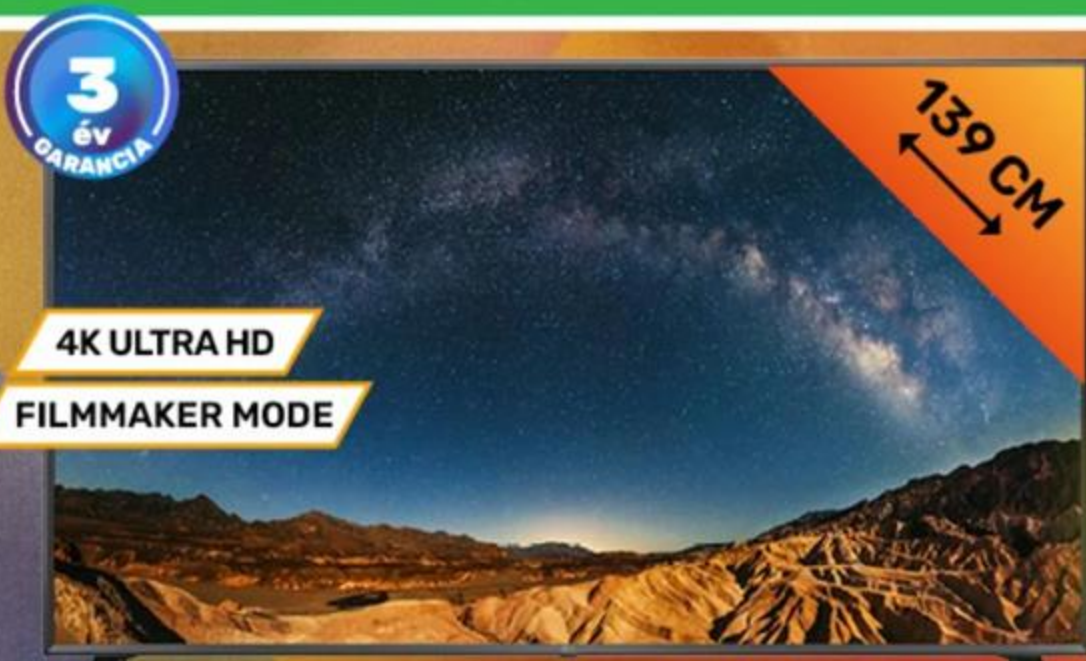
376299 LG 55" SMART LED TV 55UR781COLK, HDR, QUANTUM DOT

146 999 Ft 0% THM 10 x 14 700 Ft Hisense