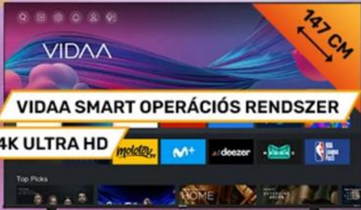
373540 HISENSE 58" SMART LED TV 58A6BG

146 999 Ft 0% THM 10 x 14 700 Ft Hisense