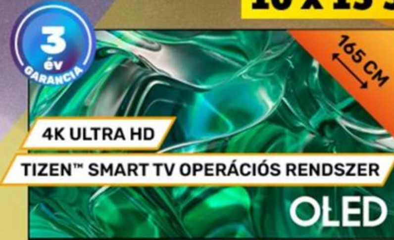
366381 SAMSUNG 65" SMART OLED TV QE65S95CATXXH, DOLBY ATMOS® LASERSLIM KIALAKÍTÁS, FREESYNC PREMIUM PRO, MI FELSKÁLÁZÁS, PANTONE TANÚSÍTOTT, MOTION XCELERATOR TURBO PRO

194 999 Ft 0% THM 10 x 19 500 Ft SAMSUNG