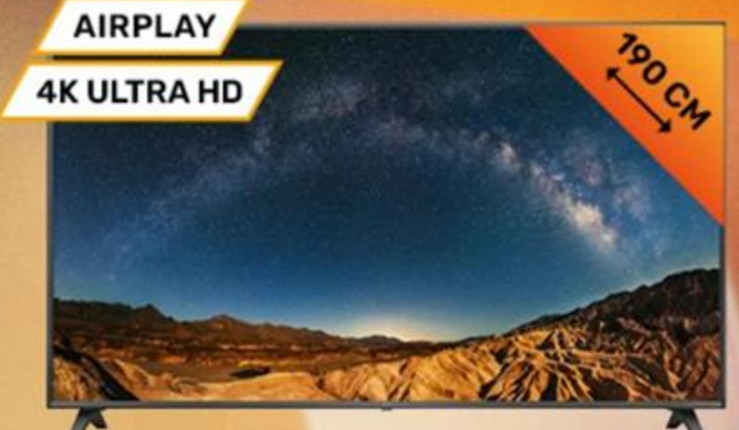
376301 LG 75" SMART LED TV 75UR781COLK

859 999 Ft 0% THM 10 x 30 000 Ft SAMSUNG Önrész: 172 000 Ft