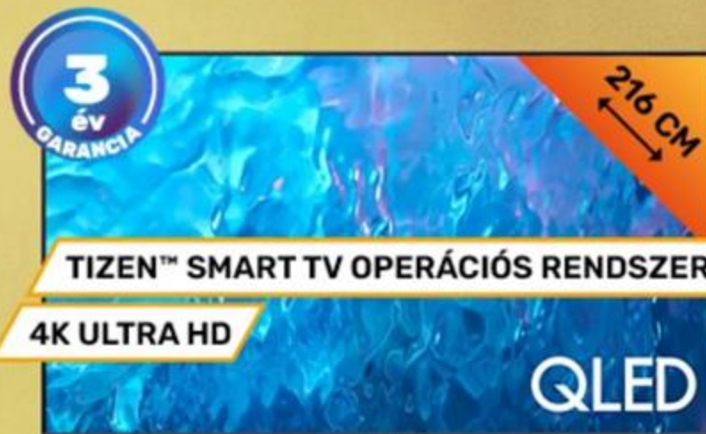
366337 SAMSUNG 85" SMART QLED TV QE85Q70CATXXH, QUANTUM HDR, PANTONE TANÚSÍTOTT, Q-SYMPHONY, FREESYNC PREMIUM PRO, MOTION XCELERATOR TURBO+

1 229 999 Ft 0% THM 10 x 98 400 Ft SAMSUNG Önrész: 246 000 Ft