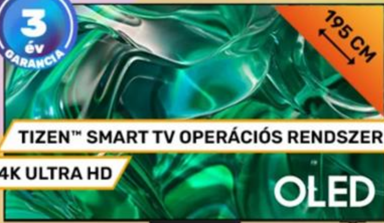
366382 SAMSUNG 77" SMART OLED TV QE77S95CATXXH, DOLBY ATMOS®, INFINITY ONE KIALAKÍTÁS, FREESYNC PREMIUM PRO, MI FELSKÁLÁZÁS, AMD FREESYNC™ PREMIUM PRO SZINTŰ TANÚSÍTÁNY, PANTONE TANÚSÍTOTT, MOTION XCELERATOR TURBO PRO

1 229 999 Ft 0% THM 10 x 98 400 Ft SAMSUNG Önrész: 246 000 Ft