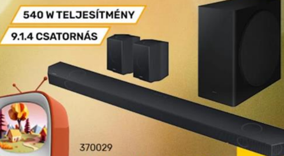
370029 SAMSUNG HANGPROJEKTOR HW-Q930C/EN, VEZETÉK NÉKÜLI DOLBY ATMOS, Q-SYMPHONY

279 999 Ft 0% THM 10 x 28 000 Ft SAMSUNG