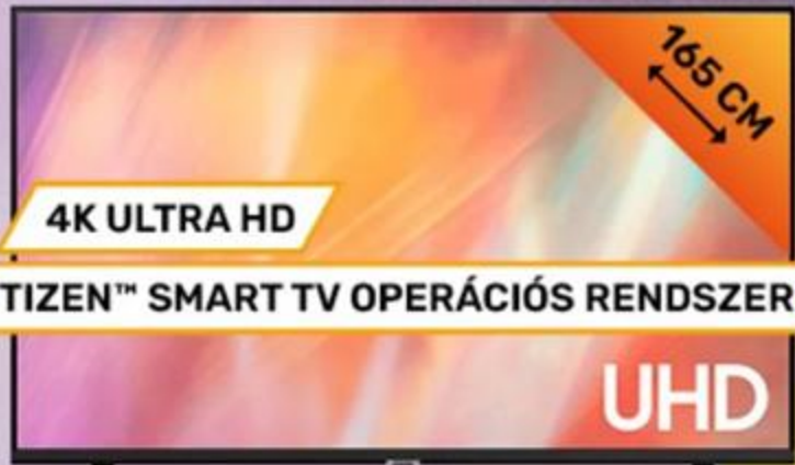
353668 SAMSUNG 65" LED SMART TV UE65AU7022KXXH

194 999 Ft 0% THM 10 x 19 500 Ft SAMSUNG