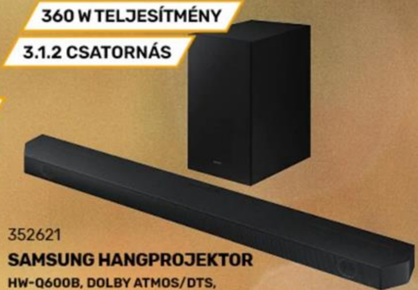
352621 SAMSUNG HANGPROJEKTOR HW-Q600B, DOLBY ATMOS/DTS, GAMER MODE PRO, SURROUND, Q-SYMPHONY

779 999 Ft 0% THM 10 x 62 400 Ft SAMSUNG Önrész: 156 000 Ft