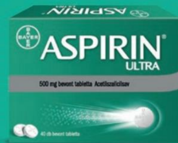
Aspirin® Ultra 500 mg bevont tableta

Az Aspirin Complex 500 mg/30 mg granulatú belsőleges szuszpenzióhoz vény nélkül kapható gyógyszer acetilszalicilsav és pszeudoefdrin-hidroklorid hatóanyagokkal. 16 év alatti gyerekek és serdülők számára a készítmény nem adható, hacsak az orvos másképpen nem rendel.