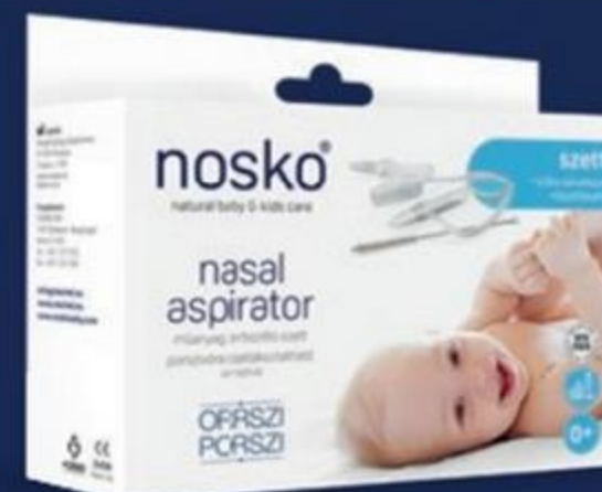
Nosko Orrszi Porszi műanyag orrtisztító szett, 2 szívó fejjel 3 429 Ft 2