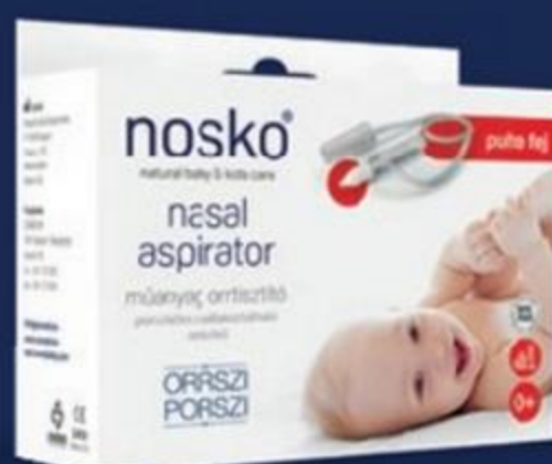
Nosko Orrszi Porszi műanyag orrtisztító, puha fejjel 2 879 Ft 2