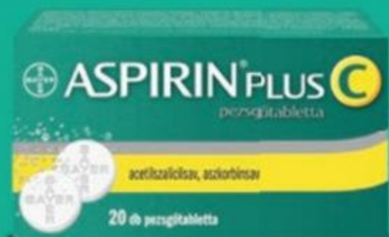
Aspirin® Plus C pezsőtabletta

4 399 Ft helyett 1 3 499 Ft 2 20 db (175 Ft/db)