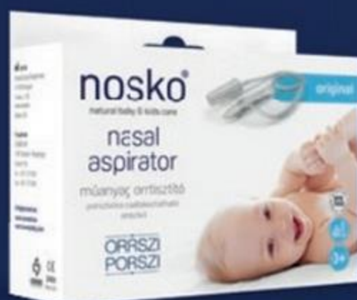
Nosko Orrszi Porszi műanyag orrtisztító, original 2 449 Ft 2