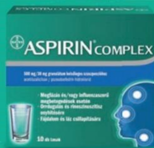
Aspirin® Complex 500 mg/30 mg granulat belsőleges szuszpenzióhoz

12 éves kor alatt a készítmény nem adható. Az Aspirin Plus C pezsőtabletta vény nélkül kapható gyógyszer acetilszalicilsav és aszkorbinsav hatóanyagokkal.