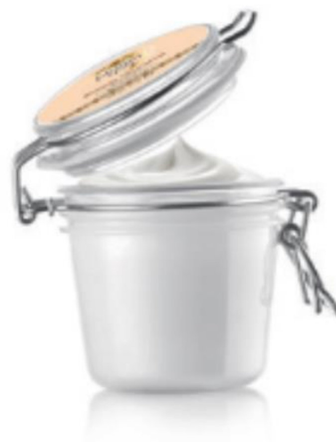
41418 Blissfully Nourishing testvaj 200 ml | 17995,00/ 1l