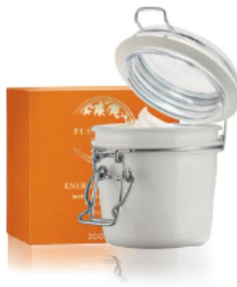
11254 Energise testvaj 200 ml | 17995,00/ 1l