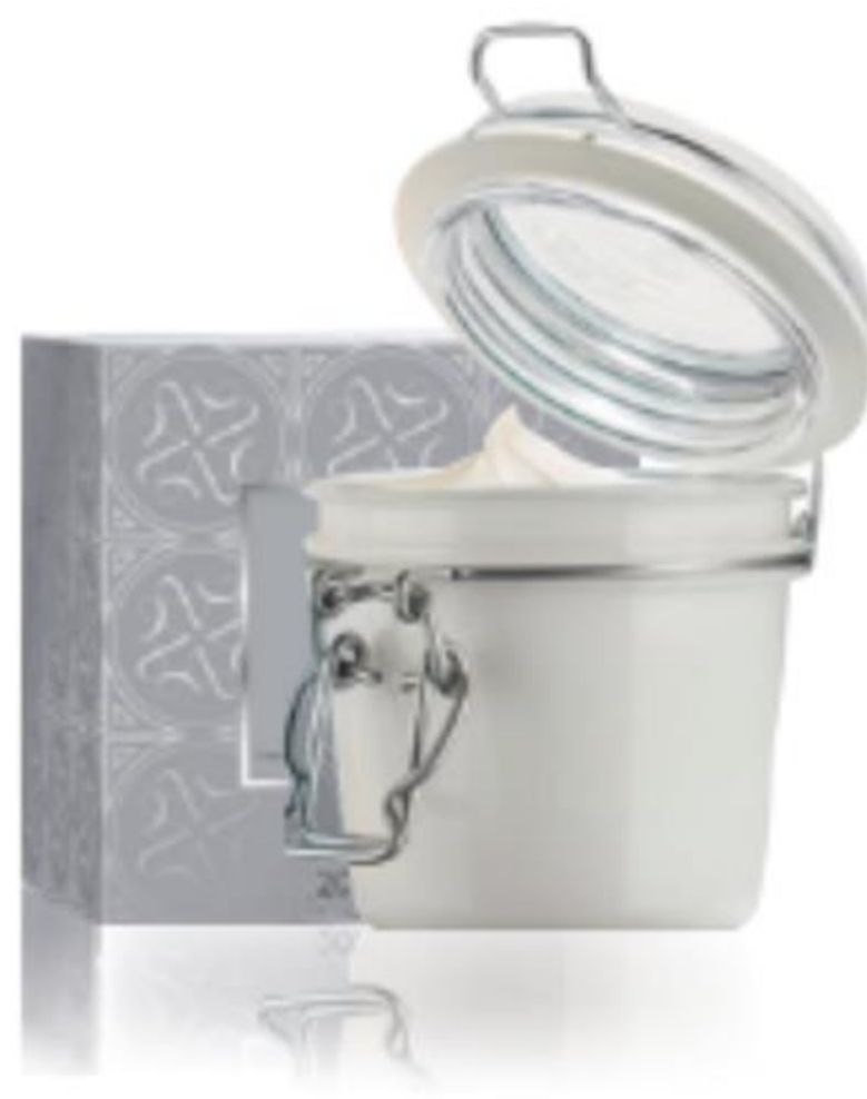
04929 Perfectly Purifying testvaj 200 ml | 17995,00/ 1l