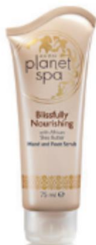
34637 Blissfully Nourishing kéz- és lábradír 75 ml | 17320,00/ 1l