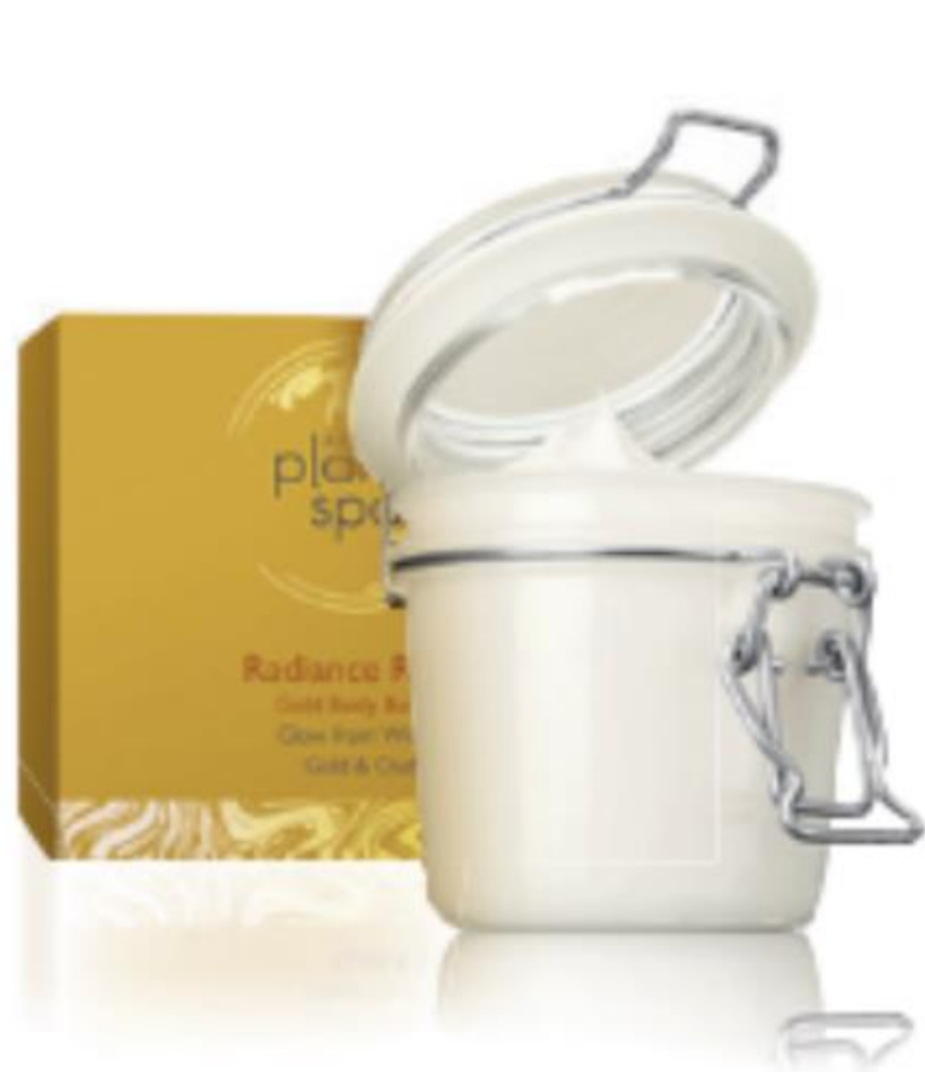
64246 Radiance Ritual testvaj 200 ml | 17995,00/ 1l