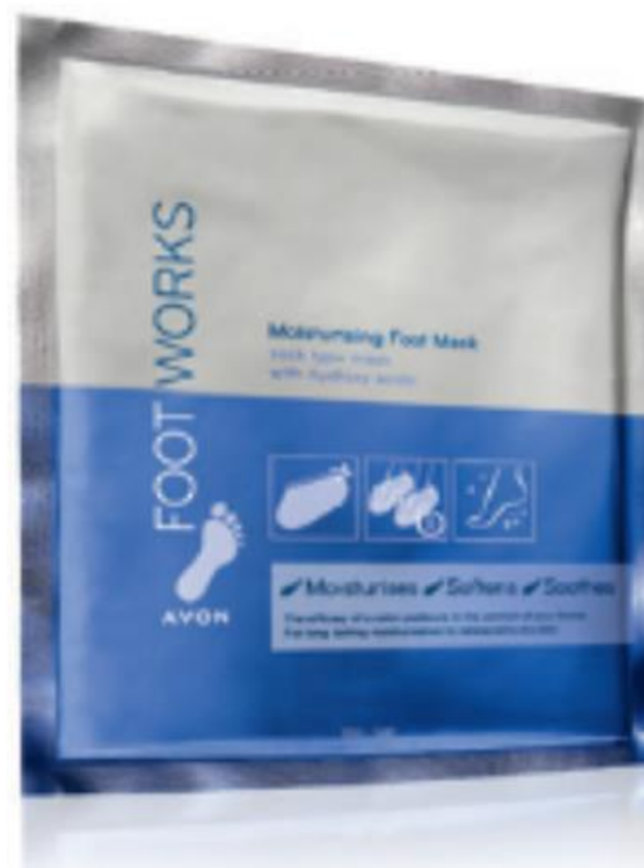
63990 Hidratáló lábpakolás E-vitaminnal és shea vajjal.