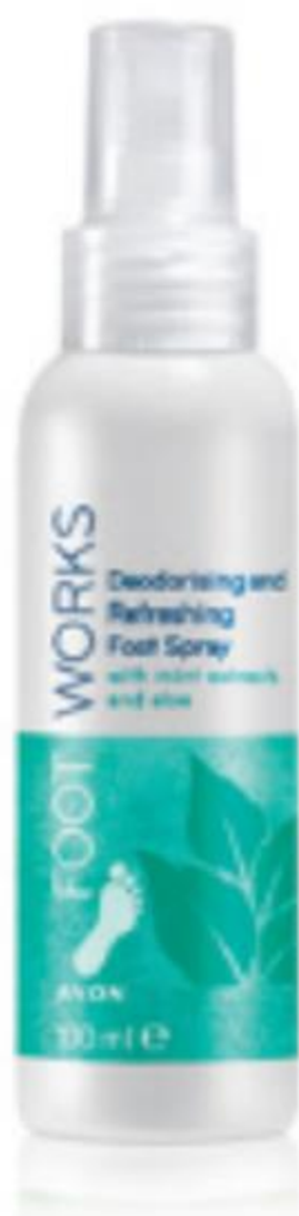
14886 Dezodoráló és frissítő láb spray mentával és aloe verával 100 ml | 13990,00/ 1l