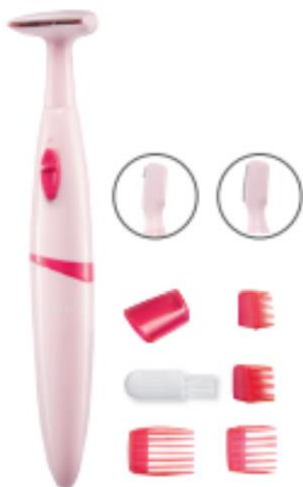
64428 Elemes trimmelő Anyaga: ABS, rozsdamentes acél. 1 db AAA elemmel működik (elem nélkül szállítjuk). Mérete 14,6 x 2 x 1,7 cm.