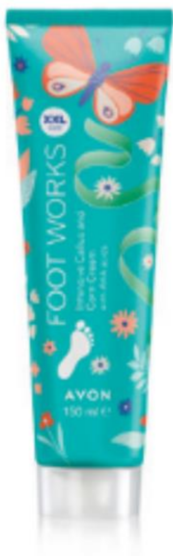
02998 Intenzív lábpuhító krém AHA-savval 150 ml | 9326,67/ 1l