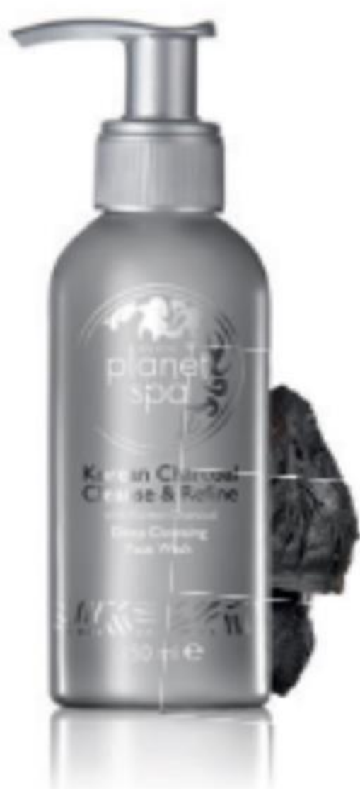
69856 Korean Charcoal mélytisztító arclemosó 150 ml | 16660,00/ 1l