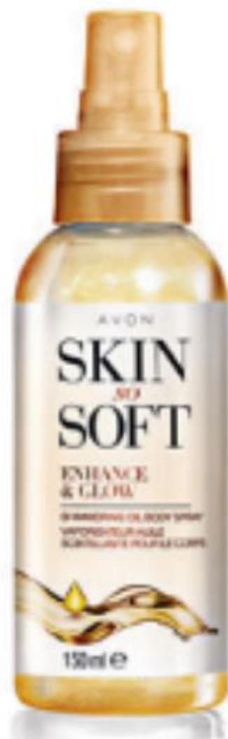
00125 Csillogó testápoló olajspray 150 ml | 10660,00/ 1l