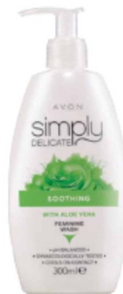
64634 Nyugtató hatású intim le mosó aloe verával 300 ml | 3663,33/ 1l